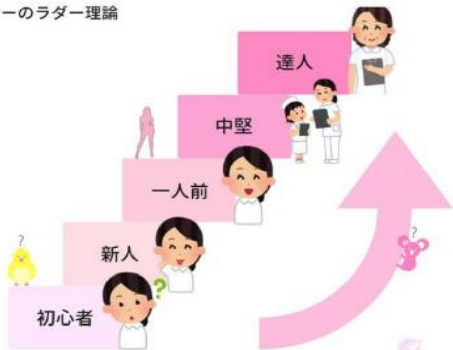
ベナーのラダー理論

能力やキャリアを開発する指標 看護教育の第一人者のパトリア・ベナーが提唱した概念