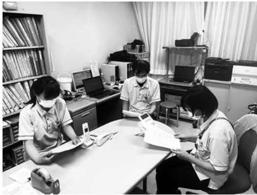
写真 ミーティングの様子

言う人であることは知っていたが、福祉用具一つにもこだわりを見せることがあり、介護支援専門員として、できる限りご本人の意向に沿う形で居宅サービス計画書を立案し、話し合いを行った。