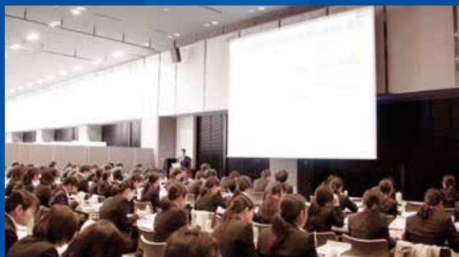
専門・認定薬剤師育成セミナーの紹介(昼食付)

AMG 薬剤部ホームページ http://www.achs.jp/yakuzaibu/